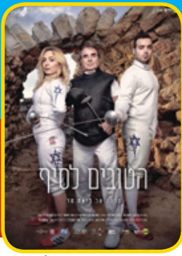
פוסטר הסרט: "הטובים לסיף" במאית: ליאת מר